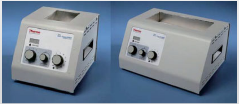
リアクティサーモ

リアクティブアップは、窒素を分岐し各バイアルに吹き付けることができるマニホールドです。リアクティサーモと組み合わせることにより、溶媒濃縮を迅速に行うことができます。