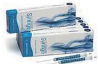
ブルーライン オートサンプリング