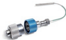
InfinityLab クイックチェンジ インラインフィルタ